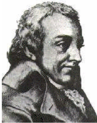
Johann Gottlieb Fichte

Aber ihnen Bürgerrechte zu geben, dazu sehe ich wenigstens kein Mittel als das: in einer Nacht ihnen allen die Köpfe abzuschneiden und andere aufzusetzen, in denen auch nicht eine jüdische Idee steckt. Um uns vor ihnen zu schützen, dazu sehe ich wieder kein anderes Mittel, als ihnen ihr gelobtes Land zu erobern und sie alle dahin zu schicken.“