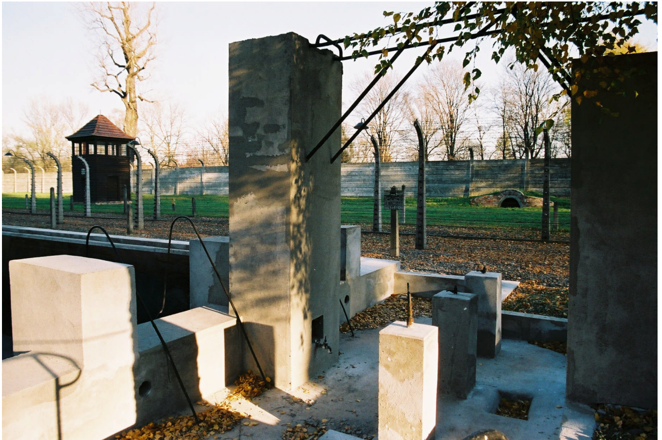
Sprungturm und Auflagen für drei Ein-Meter-Sprungbretter (Sprungbretter selbst fehlen bereits) sowie Wasserhahn für Fußwäsche