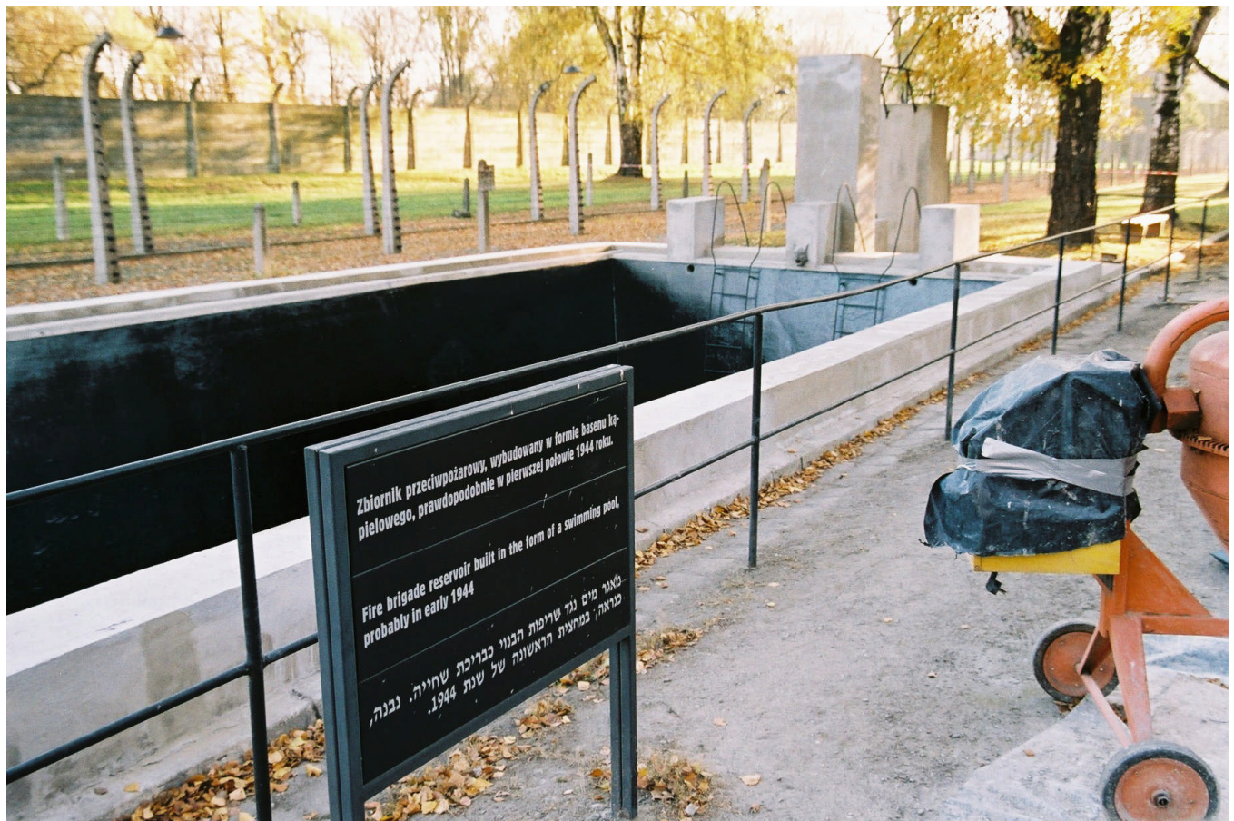
Das Schild trägt die Schrift: „Fire brigade reservoir built in the form of a swimming pool“, was auf deutsch bedeutet: „Löschwasserbecken errichtet in Form eines Schwimmbeckens“. Zu sehen sind der Sprungturm (Planke fehlt) und die Ausstiegsleitern.

Vielmehr wies ich darauf hin, daß im Konzentrationslager Auschwitz ein Wasserbecken zu besichtigen sei, das von einem Schild als „Löschwasserbecken in Form eines Swimmingpools“ bezeichnet wird (siehe Fotografie unten). Ich warf die Frage auf, warum die Nazis ein Löschwasserbecken „in Form eines Swimmingpools“ gebaut haben sollten. Zur Tarnung? Ich folgerte sinngemäß, daß man es wohl nicht gern in Betracht ziehen wolle, daß es in Auschwitz einen Swimmingpool gegeben hat, und deshalb das Becken auf die genannte absurde und lächerliche Weise bezeichnete. Denn durch die Anerkennung als Schwimmbecken würden Fragen aufgeworfen, die nicht in das Bild passen, das durch die Sieger von den Konzentrationslagern gemalt wurde und wird.